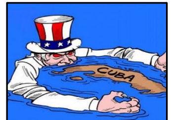
EEUU controló la política y la economía cubana durante más de medio siglo.