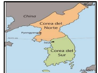
División de Corea del Norte y Corea del Sur en el paralelo 38 Norte.

El armamento comenzó a arribar a Cuba en 1962. La situación puso en alerta al mundo cuando, en el mes de octubre de ese año, aviones de reconocimiento norteamericano fotografiaron misiles instalados en la isla con un alcance suficiente para atacar casi todo el territorio norteamericano.