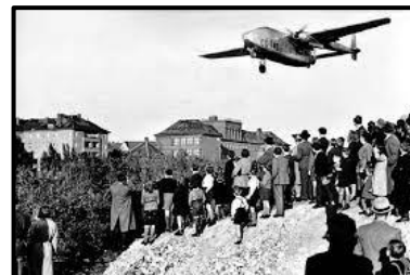
La población de Berlín occidental observa el aterrizaje de un avión norteamericano en el aeropuerto de Tempelhof en Berlín Oeste en 1948.

El bloqueo y la solución del “puente aéreo” fortaleció la posición norteamericana en Europa, pero demostró la imposibilidad de acuerdos entre EEUU y la URSS frente a la cuestión de Alemania. En 1949 Alemania quedó dividida en dos estados: la República Federal Alemana (que incluía las zonas ocupadas por las potencias Occidentales y el distrito Occidental de Berlín), con un régimen democrático liberal y con capital en la ciudad de Bonn; y la República Democrática Alemana, en la zona soviética, con un régimen comunista y con capital en el sector Oriental de Berlín.