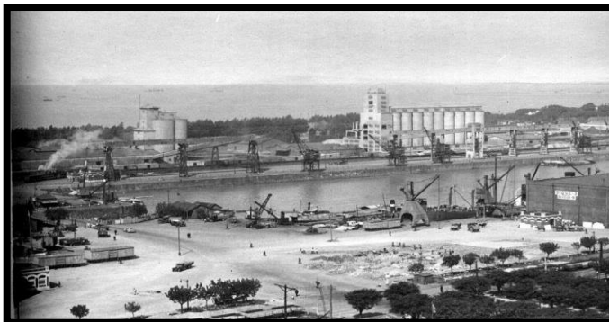
Puerto Madero. Dique 3 Ayer

6.- Observá detenidamente las imágenes, reconocé en cada una elementos naturales y las construcciones humanas, luego completá el cuadro.